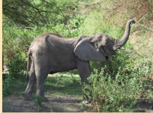
Slon u nacionalnom parku Lake Manyara