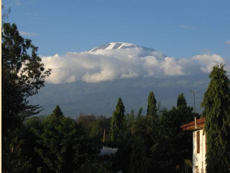
Kilimandžaro (5895m) iz Mošija (850m) 17.01. popodne