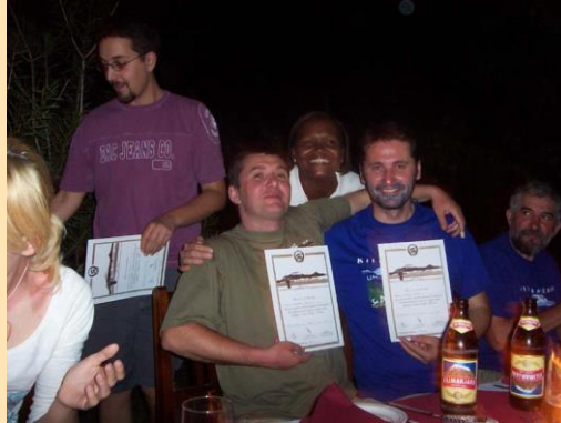
Svečana večera u Mošiju po silasku sa planine