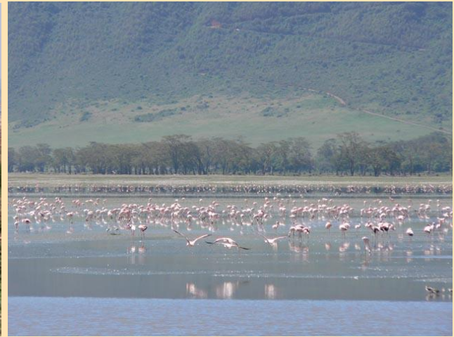
Flamingosi na jezeru

Oko 17 časova napuštamo područje jezera i brzo nastavljamo dalje ka sledećem odredištu. Radi se o velikom krateru Ngorongoro, gde treba i da prenoćimo. Ivica kratera, gde se naš kamp nalazi, je na visini od 2400 metara. To nas raduje, jer uprkos tome što će noć biti hladnija, nema opasnih komaraca.