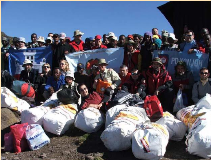
Horombo hut – pred silazak (3720m)

Ustajemo opuštено, mada malo ukočeno usled upale mišića. Nosači nam pripremaju ispraćaj. Običaj je da se u Horombo Hut-u, nakon uspešnog penjanja vrha napravi ispraćaj. U 9h nosači, vodiči, kuvari, pomoćnici se skupljaju, počinju da pevaju, tapšu i slikaju se sa nama. Mi im zauzvrat dajemo napojnice i raznorazne majice, čarape, rukavice. Uprkos tome što smo sve platili ipak smo im zahvalni, jer bez njih teško da bi napravili ovakav uspeh.