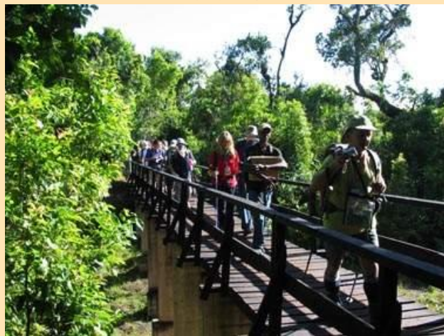
Polazak ka Mandara hut (2700m)