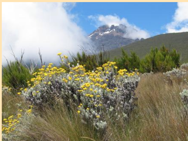
Prvi susret sa Mawenzijem (5149m)

U 15.30 nakon šest sati hoda stižemo do Horombo Hut-a, drugog visinskog logora a 3720 metara. Registrujemo se, smeštamo se u četiri kućice sa po šest ležajeva. 'ečeramo i idemo na spavanje. Ovo mesto će nam biti dom naredna dva dana koja smo dredili za aklimatizaciju. U principu, većina penjača ovde ostaje samo jednu noć, ali smo e mi odlučili za tri, sa aklimatizacionim usponima na visine iznad 4000 metara, kako bi e ovako brojna grupa u što većem broju popela na vrh.