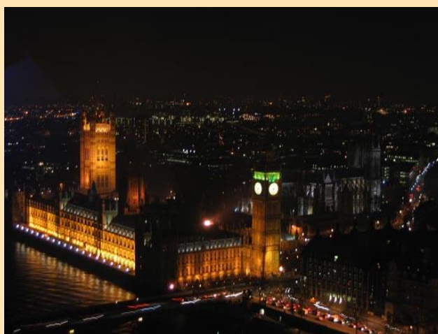
Big Ben sa London's Big Eye

Ubrzo se smeštamo u Holiday Inn-u i što autobusom, što metroom vozimo se do grada kako bi iskoristili nekoliko sati za obilazak Londona. Za kratko vreme, uspeali smo da vidimo Big Ben, kao i veliki točak – London's Big Eye, pa čak i da okrenemo jedan krug i razgledamo grad sa visine od 135 metara. Ovaj "točak" je najviši na svetu i po lepom vremenu može se videti čak 40 km unaokolo. Cena vožnje, koja traje pola sata, je 13 funti. Skupo zadovoljstvo, ali ga neki od nas nisu propustili. Uveče smo opet u hotelu, gde smo i prenoćili.