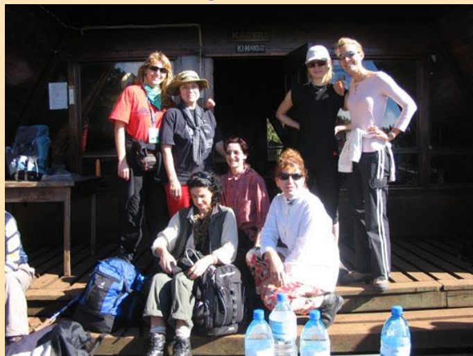
Mandara hut (2700m) – ženski deo ekspedicije

Kilimadžaro : najveći planinski masiv u Africi. Prostire se u severoistočnom delu Tanzanije. Najviša uzvišenja ove planine su: Kibo (Uhuru Peak 5895m) i kraterom prečnika oko 2500m i dubine oko 180m, Mawenzi 5151 m i Sira 4300 m. Na Kiliju se smenjuju različite klimatske zone: tropski predeo do 2800m, pa deo sa niskim rastinjem do 4000m, alpska pustinja i Ice Cap ili večiti led. Vrh Kibo-a je prvi put osvojen 1889. godine, a Mawenzi tek 1912. Jugosloveni su prvi put popeli Uhuru 7.11.1954. godine.