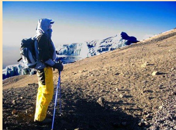
Još 100-tinak metara do vrha