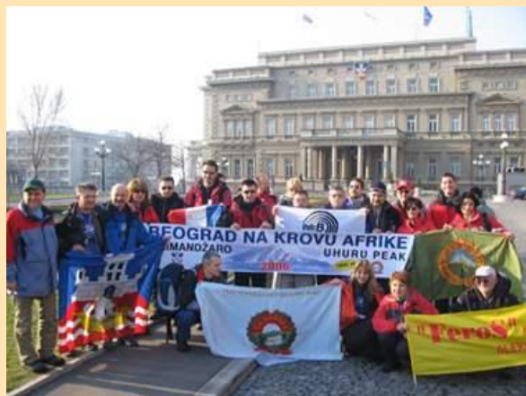
Članovi ekspedicije pred polazak