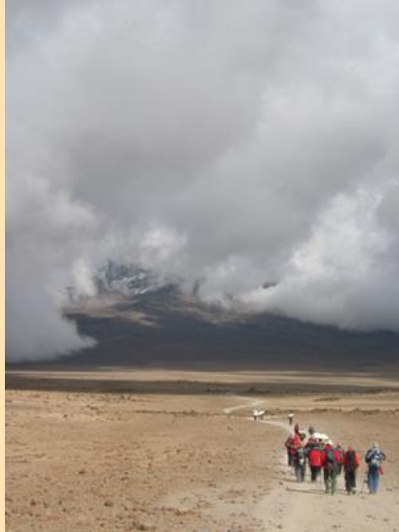
Silazak ka Horombo hut, Mawenzi u oblacima