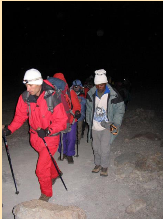
Početak uspona na Uhuru peak (5895m)

23. januar nam počinje dva sata "ranije". Jedva dočekasmo tu dugo sanjanu noć. Često sam slušao da je jako teško nakon samo par sati odmora ustati i krenuti u hladnu planinu. Ne znam kako, ali nije mi teško. Mišići mi podrhtavaju pod naletom adrenalina.