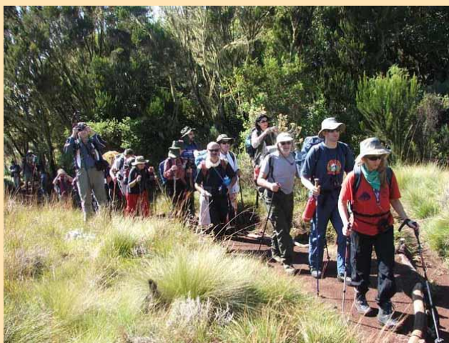
Uspón od Mandara hut (2700m) ka Horombo hut (3720m)

Ujutro u 9.20 nastavljamo dalje ka sledećem visinskom logoru. Ubrzo smo izšli iz šume i na oko 3000 metara visine okruženi smo samo niskim rastinjem. Oko nas su letele neke čudne i slatke ptičice. Uskoro se pred nama otkrio prelepi vrh Mawenzi. Na 3500 metara pravili smo dužu pauzu kako bi ručali. Dok smo jeli oko nas su obletali crni gavranovi. Na većim visinama oni su jedina bića koja nam prave društvo.