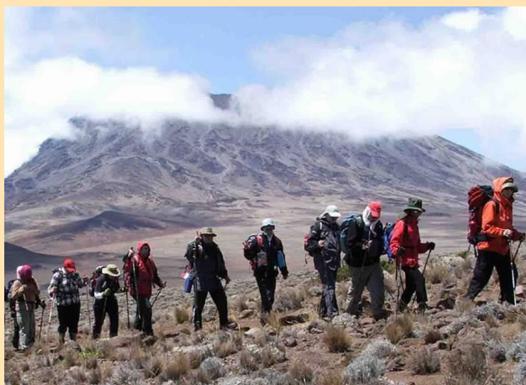
Aklimatizacioni uspon ka Mawenzi hut (4535m)

Nakon jutarnjih aktivnosti koje su se ogledale u umivanju, doručku i pakovanju, tačno u 9.25 pošli smo na aklimatizacioni uspon ka Mawenzi Hut-u. Veoma sporim hodom, uživajući u prelepom pogledu na Kibo, Mawenzi, oblake ispod nas kao i "zebra stene" u 13.15 izašli smo na visinu od 4535 metara, do Mawenzi hut-a. Vrlo kratko smo se odmorili i vratili se u Horombo u 15.30. Ostatak dana smo proveli u odmoru, uz naravno obilni ručak i večeru. Neću ni pominjati da smo se i dalje nalivali litrama i litrama vode.