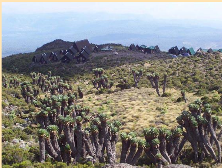
Horombo hut (3720m)