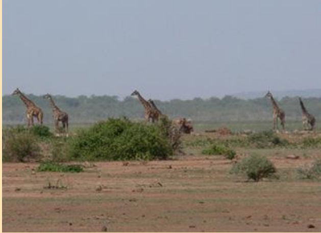
Žirafe u nacionalnom parku Lake Manyara