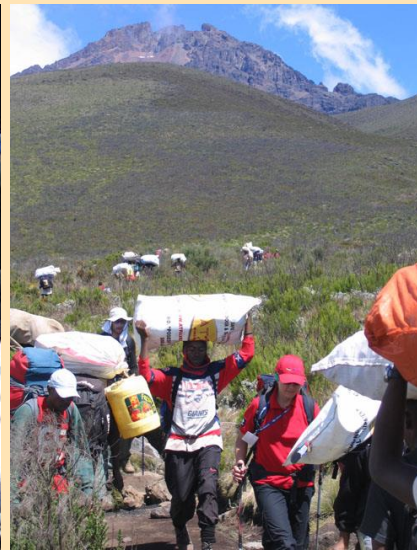
Silazak ka Mandara hut

U 10.30 ceremonija je završena i krećemo dole. Na stazi je prilična gužva. Većina nosača i penjača idu gore, dok mi silazimo. Stalno se čuje: Hello, hi, good luck ili jednostavno džambo! Napravili smo još jednu dužu pauzu kog Mandara Hut-a, a zatim se već poznatom stazom kroz prašumu spustili do ulaza. Ovde smo se zadržali oko sat vremena kako bi dobili sertifikate za uspešno penjanje vrha za svakog člana ekspedicije.