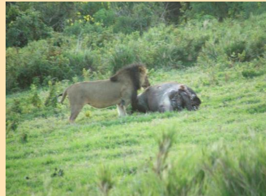
Lav i bufalo - Ngorongo

U 17.45 nalazimo se na ulazu u Ngorongoro. Prolazimo dalje i dolazimo do prelepog