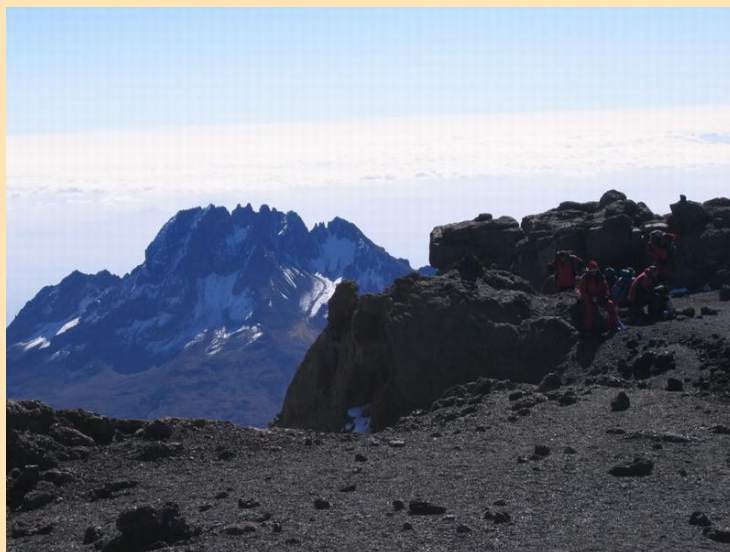
Na ivici kratera - Stela point (5750m) sa Mawenzijem (5149m) u pozadini

Na raspolaganju nam je manje od polovine kiseonika dostupnog na nivou mora i sada svako ide svojim tempom. Svako vodi svoju unutrašnju bitku. Ovde iznad 5700 metara visine bitna je samo volja. Posmatram planinare naše ekspedicije i obuzima me osećaj neverice i sreće jer shvatam da ćemo ubrzo svi stajati na vrhu. Jasno je da svi žele gore."