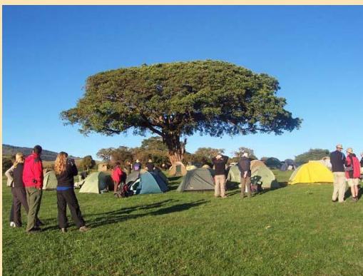
Simba kamp – Ngorongoro

Oko 17 časova napuštamo područje jezera i brzo nastavljamo dalje ka sledećem odredištu. Radi se o velikom krateru Ngorongoro, gde treba i da prenoćimo. Ivica kratera, gde se naš kamp nalazi, je na visini od 2400 metara. To nas raduje, jer uprkos tome što će noć biti hladnija, nema opasnih komaraca.