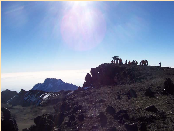
Uhuru peak (5895m) – planinari naše ekspedicije na vrhu, u pozadini Mawenzi (5149m)