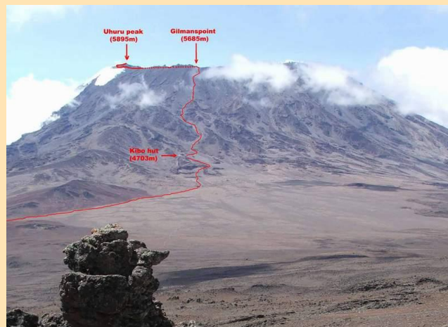
Smer uspona sa Sedla (4500m) preko Kibo Hut-a (4703m) i Gilmanpointa (5685m) do Uhuru Peak-a (5895m)