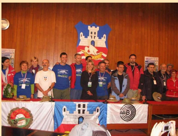
Sa konferencije za štampu

I tu je kraj. U 14:20 grupa koja je zajedno prebrodila velike avanture se razilazi, ali sa osećajem da jedva čekamo opet da idemo.