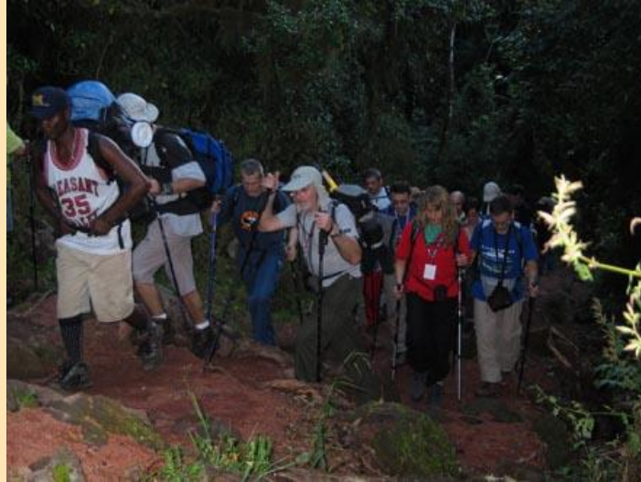
Uspon ka Mandara hut

U 19.20, sada već po mraku, eto nas u prvom visinskom logoru - Mandara Hut, na 2700 m. Smeštamo se u nekoliko prostorija i uskoro večeramo. Našim vodičima dajemo prazne flaše kako bi ujutro imali dovoljno vode za dalje napredovanje. Voda koju pijemo je iz lokalnih potoka i neophodno je prokuvati. Tu postoji jedan problem. Voda na većim visinama provri na temperaturi nižoj od 100 stepeni, pa mi ipak koristimo jod ili pilule za dezinfekciju.