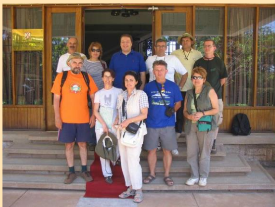
Ispred našeg Konzulata