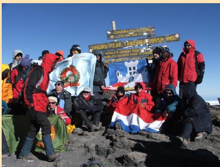
Na najvišem vrhu Afrike – Uhuru peak (5895m), 23.januar 2006. 8h ujutru