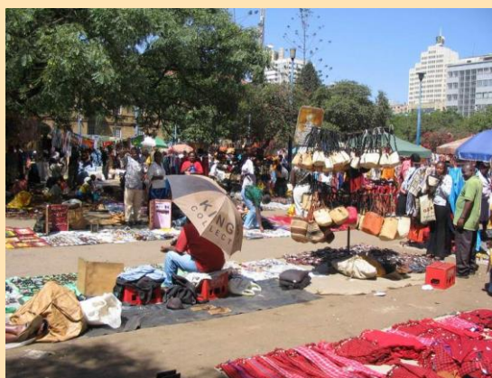
Pijaca u Najrobiju

Uveče nas čeka novo iznenađenje. Preporučan nam je odličan restoran gde uglavnom odlaze belci i turisti. Zove se "Mesožder" i u potpunosti opravdava svoje ime. Mesta se moraju rezervirati unapred, a cena je oko 1800 šilinga ili 20 i nešto dolara. Skoro svi smo otišli tamo. Specifičnost restorana je da je u etno stilu i da se za cenu ulaznice mogu konzumirati enormne količine najrazličitijeg mesa sa roštilja. Zapravo, može se jesti onoliko koliko se može podneti. Konobari donose meso direktno sa roštilja i seku ga mačedom na tanjir. Pri tome se služe raznorazni odgovarajući sosevi. Tako smo jeli: noja, krokodila, zebru, kamilu... kao i uobičajeno: prasetina, jagnjetina, piletina, ćuretina... Na sredini stola postoji zastavica i kada se više ne može jesti ona se obori. To je znak da se može poslužiti dezert. Ovo mesto svakako treba posetiti u Nairobiju.