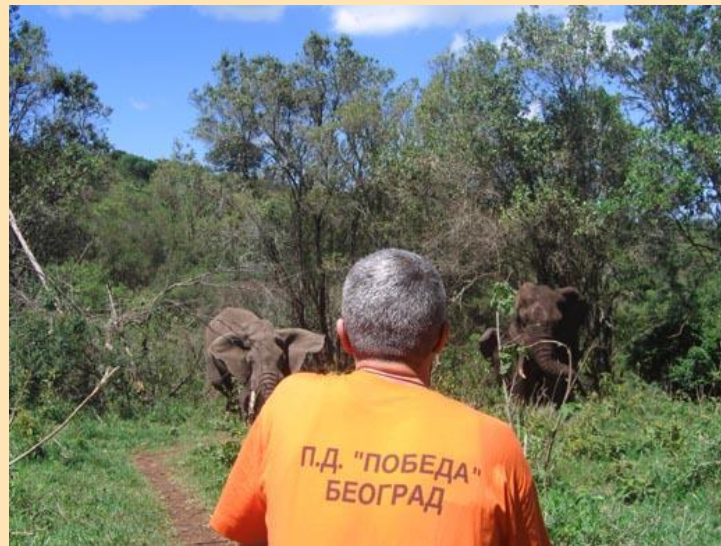
Susret sa slonovima

Sat vremena iza podneva krećemo uz brdo van kratera. Put je vrlo loš, ali se nekako u 13:30 nalazimo u našem kampu, gde smo spavali prošlu noć. Ovde imamo ručak koji je vrlo sličan onome što smo jeli na planini. Koristimo priliku da se slikamo sa slonovima koji su došli do kampa. Ovoga puta nismo u vozilima i oprezno im se približavamo pazeći da ih ne uznemirimo.