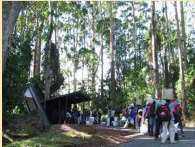
Marangu gate (1850m)

Nastavljamo dalje. Lično, meni je ovaj deo kroz šumu, pardon, prašumu najlepší deo kojim sam hodao. Takvu floru i faunu nikada nisam video, i nadam se da ću se opet kretati sličnim predelima.