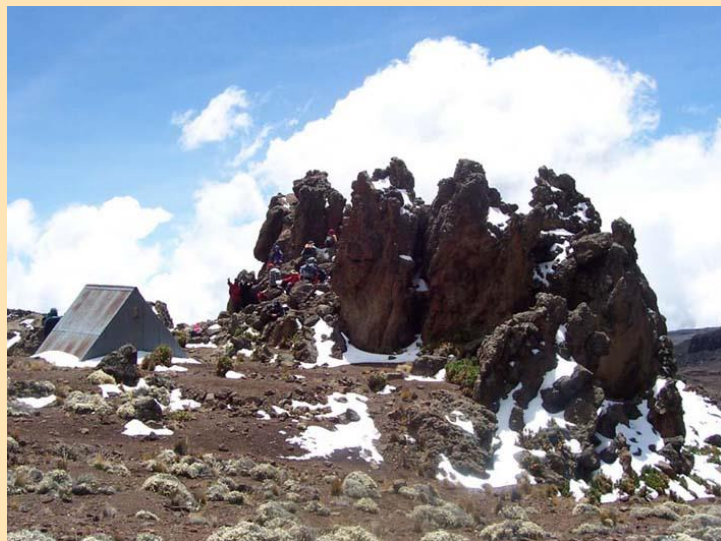
Mawenzi hut (4535m)