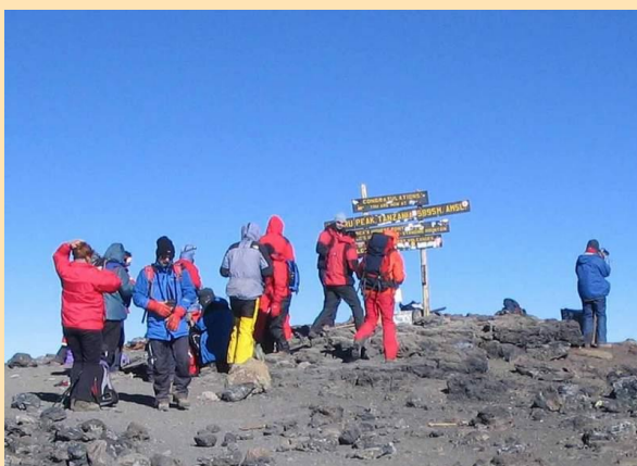
Dolazak na vrh (5895m)