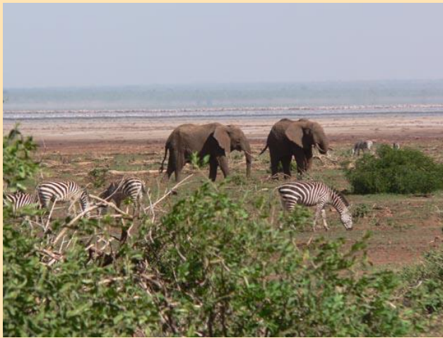
Nacionalni park Lake Manyara