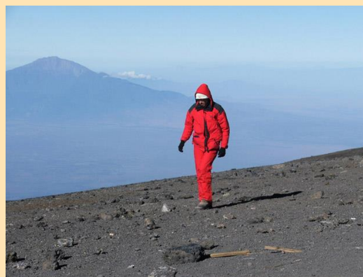
Uhuru peak (5895m), u pozadini Šira (4300m)

Pola sata smo na vrhu i krećemo dole. Čeka nas dugačak povratak. Uspon je završen tek kada se svi spuste sa planine. Treba stići do Horombo Hut-a. Umor je ogroman, a deficit kiseonika nas bukvalno lomi. Nekako, oko podne i poslednji čovek iz naše grupe je u Kibo Hut-u. Umorni smo. Ručamo i osećamo se mnogo bolje. Krećemo dalje u 15h i za tri sata stižemo u nama dobro poznati Horombo Hut. Smeštamo se.