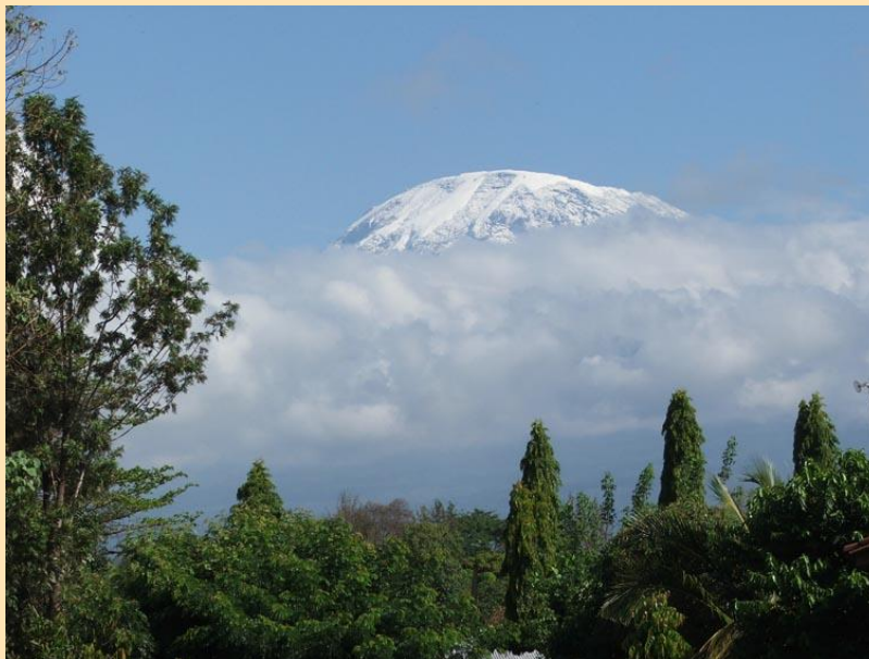
Jutro 18.01. osvanulo je sa novim snegom na Kilimandžaru